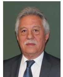
Ricardo Cámara Cónsul General de México en Atlanta

Reúne los documentos necesarios, ten a la mano tus identificaciones vigentes, comprobante de domicilio y acta de nacimiento, para que puedas ser partícipe de la democracia en México desde el extranjero.